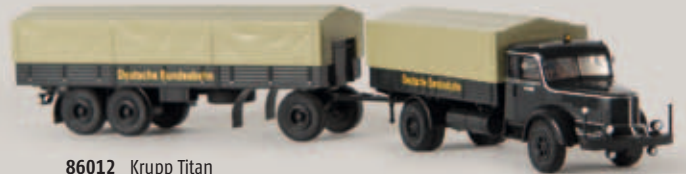
86012 Krupp Titan „Deutsche Bundesbahn“, TD