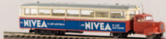
Sylter Inselbahn LT 4 64202 „Nivea“