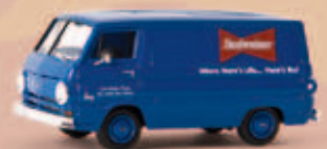
v 34361 Dodge A 100 Van „Budweiser“, TD