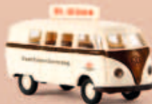
v 31020 VW Kombi T1a „Dr. Oetker Hausfrauenberatung“