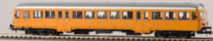
Esslinger Triebwagen VT 402, TD v 64104 „WEG“, DC v 64124 „WEG“, AC