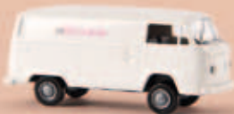
v 33528 VW Kasten T2 „Telekom“