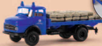
v 47120 MB LA 322 „THW“ mit Sandsäcken als Ladegut