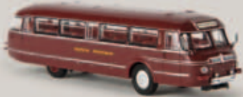
59350 NWF BS 300 Stromlinienbus „DB“, TD