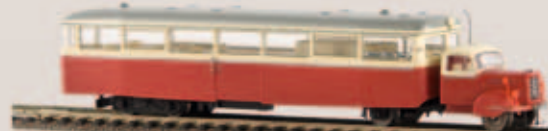
Sylter Inselbahn LT 4 64201 hellelfenbein/rot