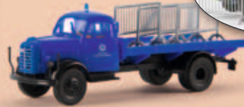
v 43024 Borgward B 4500 „THW“ mit Absperrgittern