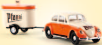
n 25036 VW Käfer mit Verkaufsanhänger „Pfanni“