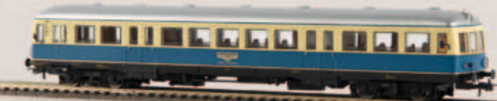
Esslinger Triebwagen VT 04, TD 64103 „Regentalbahn“ DC v 64123 „Regentalbahn“ AC