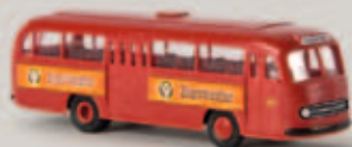
52371 MB 0 321 H Stadtbus „DB/Jägermeister“