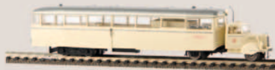
Sylter Inselbahn LT 4 64200 elfenbein