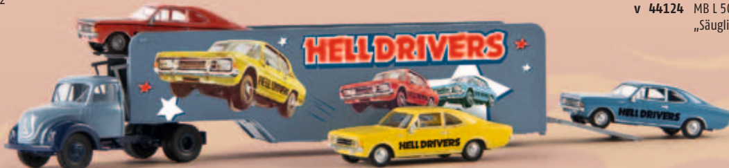
v 42232 Magirus Autosattelzug „Hell Drivers“ incl. 3 Modellen