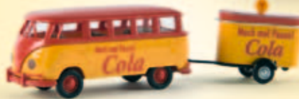
n 31828 VW Mindersamba T1b mit Verkaufsanhänger „Cola“