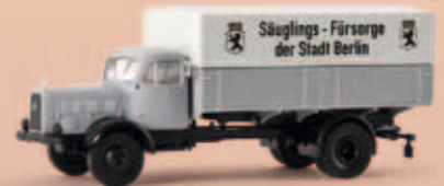
v 44124 MB L 5000 „Säuglingsfürsorge Berlin“