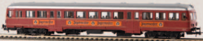
Esslinger Triebwagen, VT 104, TD 64101 „SWEG/Jägermeister“, DC v 64121 „SWEG/Jägermeister“, AC