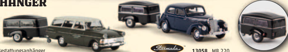
20170 Opel P11 mit Bestattungsanhänger „Sargschreinerei Wagner“, TD