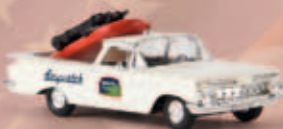
v 19941 El Camino „Baywatch“, TD