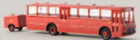
59036 MB 0 317 K mit Anhänger „DB“