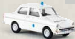
27707 DAF 750 „Politie“