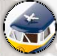
v 32705 VW Kasten T1b „ASG“