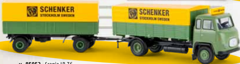
v 85052 Scania LB 76 „Schenker Stockholm“