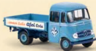
13559 MB L 319 „Afri-Cola“