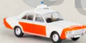
19411 Ford 17m „Rijkspolitie“