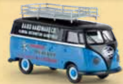
v 32704 VW Kasten T1b „Mercury Bootsmotoren“