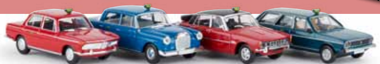
v 90467 Sparsset 2 „Taxa“ aus DK (BMW, MB 190c, Rover, VW Passat)