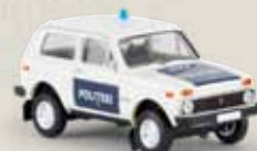
27227 Lada Niva „Politsei“