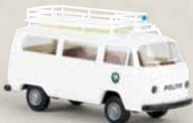
33132 VW T2 „Politie“