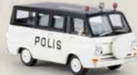
34303 Dodge A 100 „Polis“