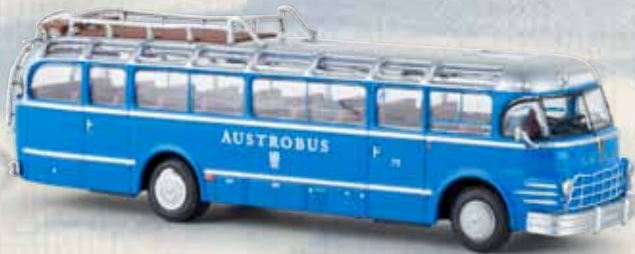
58061 Saurer 5 GVF-U Bus „Austrobus“ Starline models