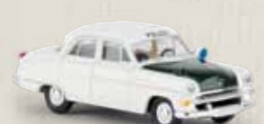
20869 Opel Kapitän 1954 „Polizei“