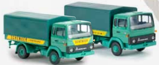
34706 Magirus MK „Schenker Lüneburg“