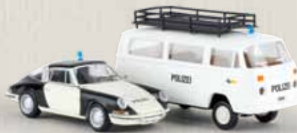
99293 2er Set „Kantonspolizei Zürich“