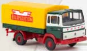
34755 Volvo F613 „Bilspedition“