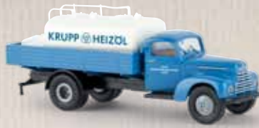
v 49031 Ford FK 3500 „Krupp Heizöl“