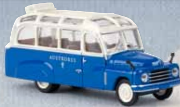
v 58186 Hanomag L 28 Lohner „Austrobus“ Starline models