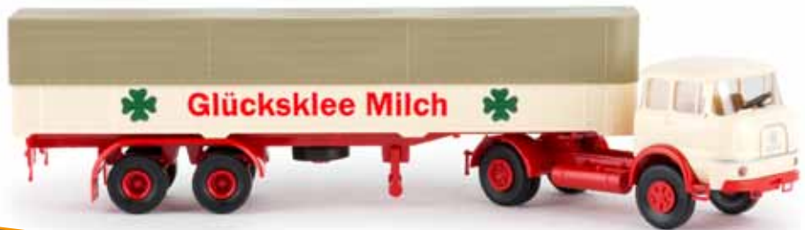
84115 Krupp SF 980 „Glücksklee“