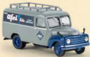
v 58165 Hanomag L 28 Kasten „Afri-Cola“