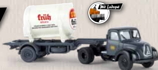
v 42262 Magirus Mercur mit Container-Auflieger „Früh-Kölsch“