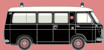
v 34409 Fiat 238 Krankenwagen „Falck“, schwarz/weiß