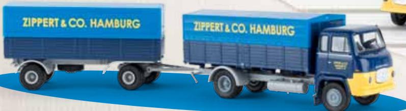
v 85054 Scania LB 76 „Zippert & Co.“ (sortiert)