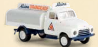
35331 Opel Blitz „Alsina“