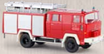
v 58804 Magirus D LF 16 TS „WF Krupp Duisb. -Rheinhausen“