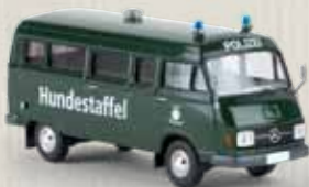
v 13264 MB L 206 D „Hundestaffel Niedersachsen“