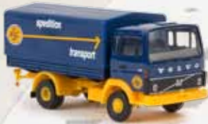
34754 Volvo F613 „ASG“