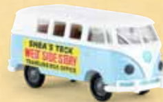
v 31589 VW Kombi T1b „Ticketverkauf West Side Story“