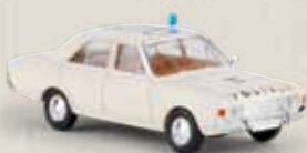
19403 Ford 17m „Polizei“