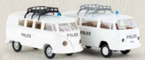
v 99294 2er Set „Police Waadt/Vaud“