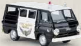
34310 Dodge A 100 „Sheriff“