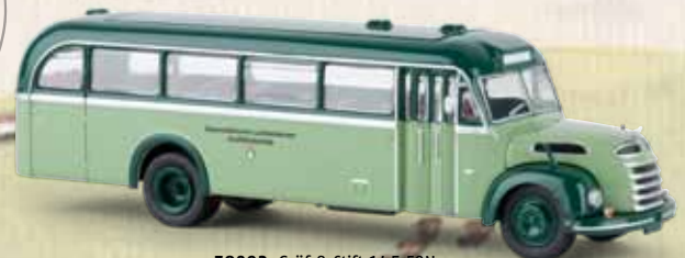
58092 Gräf & Stift 145 FON „Steiermärk. Landesbahnen“ Starline models