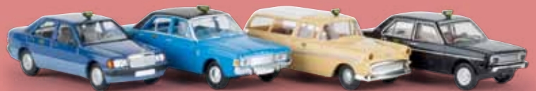
v 90466 Sparsset 1 „Taxa“ aus DK (MB 190E, Ford 20m, Opel P1, Fiat 131)