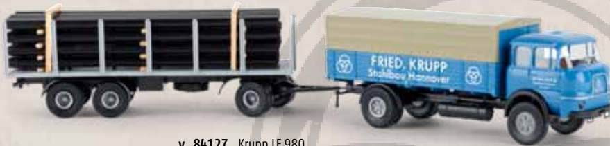
v 84127 Krupp LF 980 „Krupp Stahlbau Hannover“