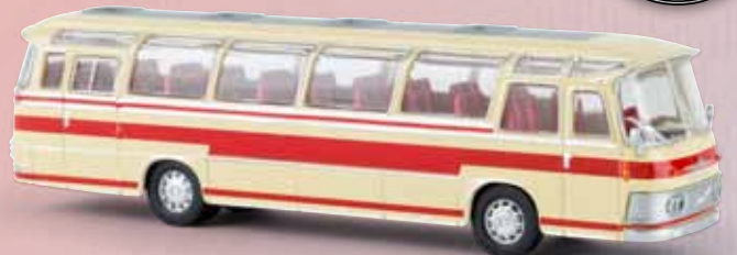
58230 Neoplan NS 12 „PTT“