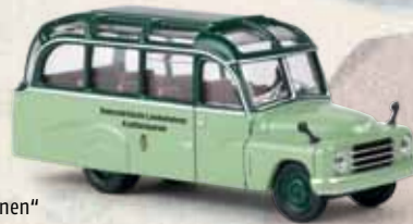
v 58187 Hanomag L 28 Lohner „Steiermärk. Landesbahnen“ Starline models