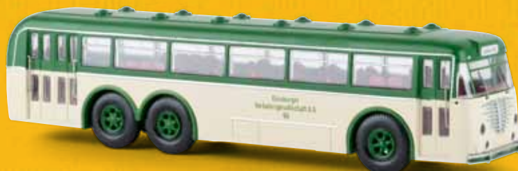
v 59422 Büssing 12000 T „Duisburg“