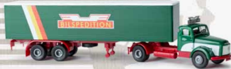
85617 Volvo N 88 „Bilspedition“