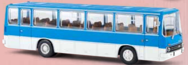
v 59560 Ikarus 66 Berliner Verkehrsbetriebe (BVB)