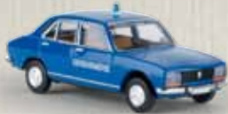
29107 Peugeot 504 „Gendarmerie“