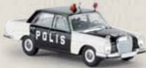
13105 MB 280 SE „Polis“