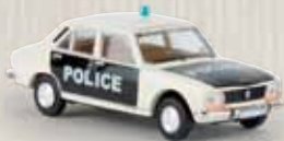
29108 Peugeot 504 „Police“