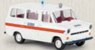
34060 Ford Transit Kombi „Police“