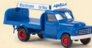
37127 Hanomag L 28 „Aquila“