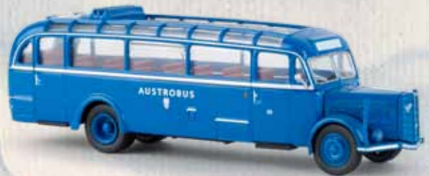
58074 Saurer BT 4500 „Austrobus“ Starline models