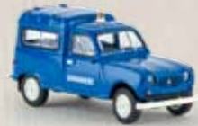
14720 Renault R4 Fourgonnette „Gendarmerie“