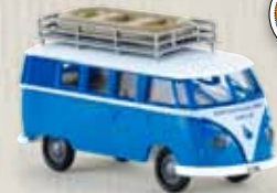
90890 VW Kombi T1b „Seepolizei Zürich“