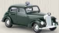
13055 MB 220 „Polizei“