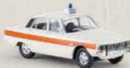
15107 Rover P6 „Police“