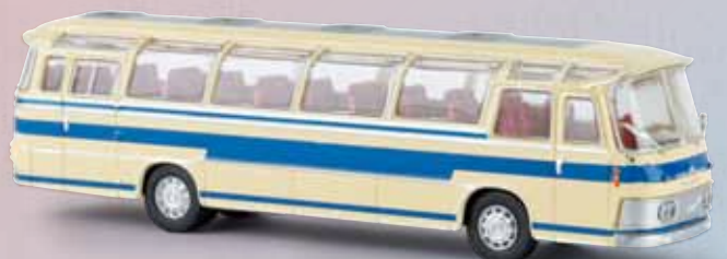
58232 Neoplan NS 12 „Alpenperle“