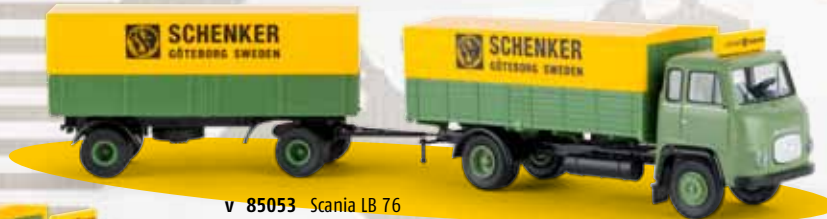
v 85053 Scania LB 76 „Schenker Göteborg“