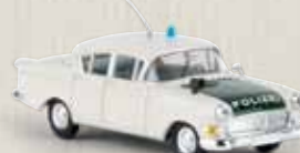
20835 Opel Kapitän P 2.5 „Polizei“