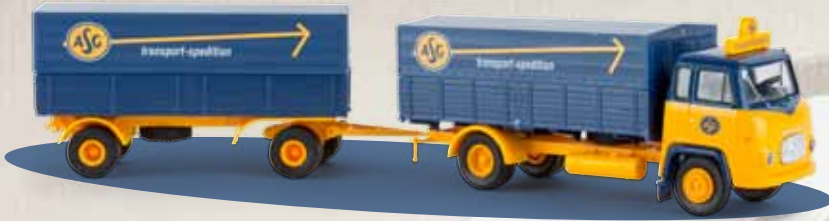
v 85050 Scania LB 76 „ASG“