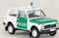
27214 Lada Niva „Polizei“