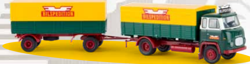
v 85051 Scania LB 76 „Bilspedition“