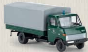
v 37523 Hanomag-Henschel F55 „Polizei Schleswig-Holstein“