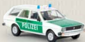
25606 VW Passat Variant „Polizei“