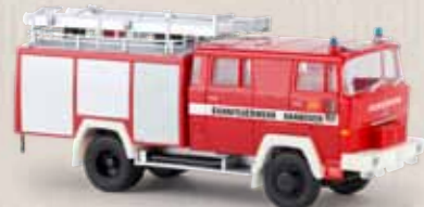
v 58803 Magirus D LF16 TS „Bahnfeuerwehr Hannover“