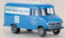
v 35615 Opel Blitz „Konsum-Anstalt Friedrich Krupp“