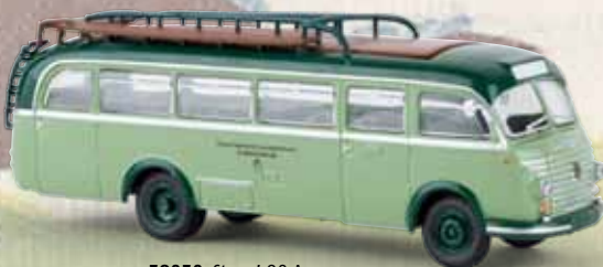
58050 Steyr 480 A „Steiermärk. Landesbahnen“ Starline models