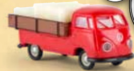
v 32974 VW T1b mit Westfalia-Pritsche und Ladegut, rot