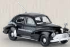
29055 Peugeot 203 „Gendarmerie“