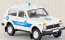
27226 Lada Niva „Polizei Bosnien“