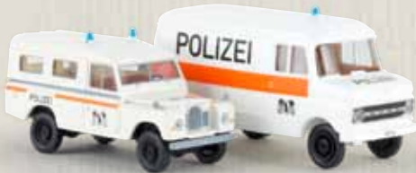
99292 2er Set „Polizei Basel Stadt“