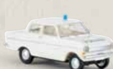
20310 Opel Kadett A „Polizei“