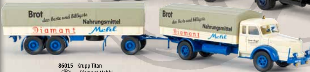
86015 Krupp Titan „Diamant Mehl“