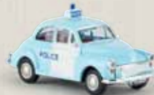
15204 Morris Minor „Police“