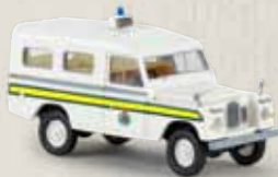
13763 Land Rover 109 „Police“