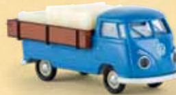
v 32973 VW T1b mit Westfalia-Pritsche und Ladegut, brillantblau