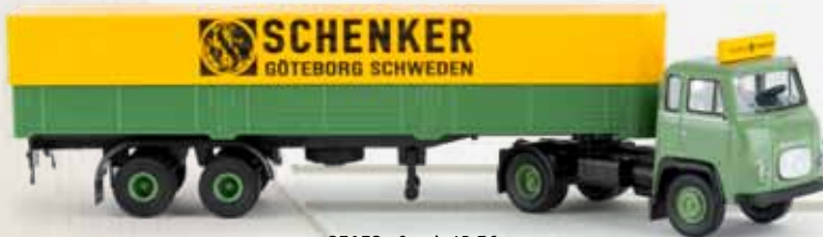
85152 Scania LB 76 „Schenker“