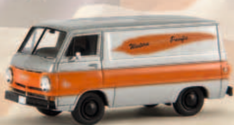
34356 Dodge „Western Pacific“, TD