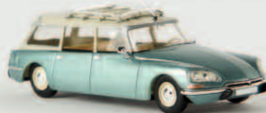
v 14210 Citroen DS Break, grün-metalllic/grau, TD