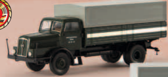
v 71029 IFA H 6 „VEB KVK Zittau RP 21-15“