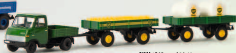
v 37611 HHF/Enser mit 2 Anhängern „BP Gas“