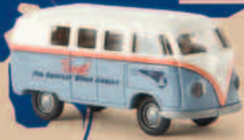
v 31019 VW Kombi T1a „PanAm“