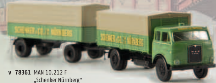
v 78361 MAN 10.212 F „Schenker Nürnberg“