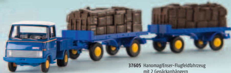
37605 Hanomag/Enser-Flugfeldfahrzeug mit 2 Gepäckanhängern