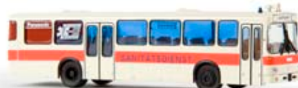
50610 MB O 307 „Sanitätsdienst“, TD