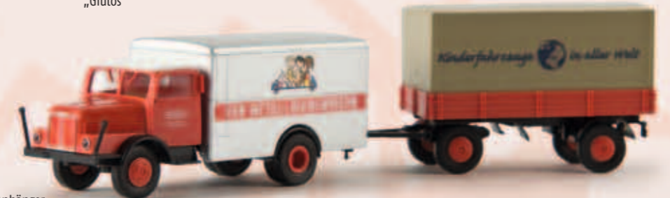
v 71672 IFA S 4000-1 mit Anhänger „VEB Metallwarenwerk“