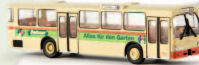
v 50727 MB O 305 aus Karlsruhe „Dehner“, TD