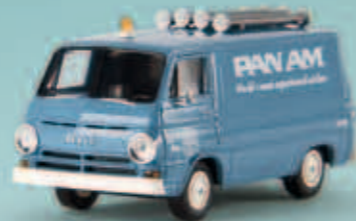
34358 Dodge A 100 „PanAm“, TD