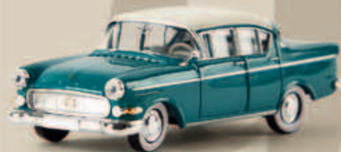
v 20836 Opel Kapitän P 2.5, wasserblau/weiß, TD