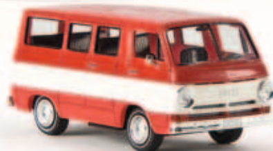
v 34306 Dodge A 100 „Custom Sportsman“ signalrot/weiß, TD