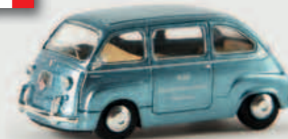
v 22462 Fiat Multipla „RAI“, TD