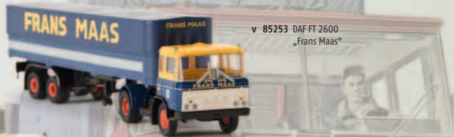
v 85253 DAF FT 2600 „Frans Maas“