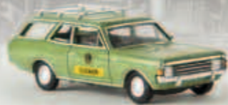
v 20561 Opel Rekord C Caravan „Schenker“ von Drummer