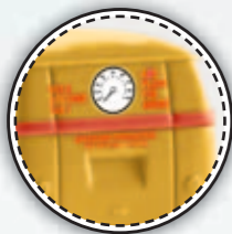
v 32033 VW Kasten T1a „Falck Speedometervogn“ (DK)