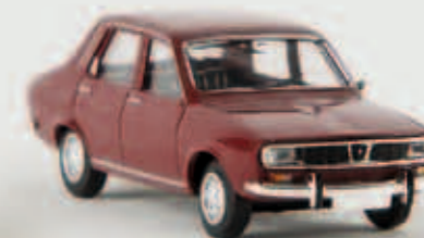
v 14513 Renault 12 TL, weinrot, TD