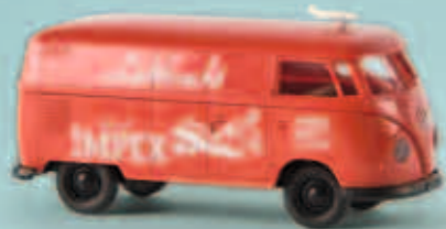
32569 VW Kasten T1b „Impex-Luftfracht“