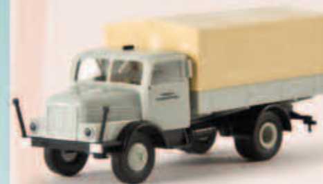
v 71523 IFA S 4000-1 „Schwarze Pumpe“