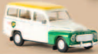
v 29315 Volvo Duett „air BP“, TD