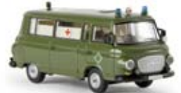
30028 Barkas B 1000 BePo-Krankenwagen, TD