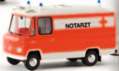
n 36902 MB L 508 RTW „Feuerwehr Notarzt“, TD