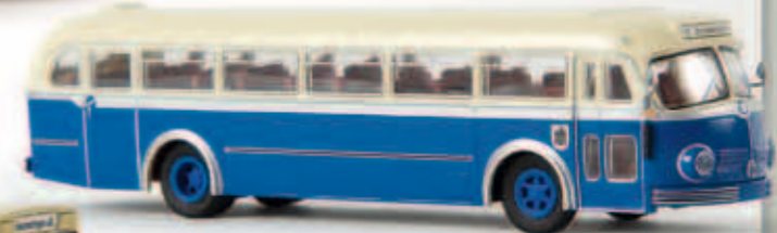
50514 MB O 6600H aus München, TD