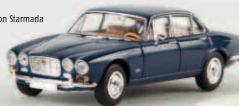
v 13654 Jaguar XI 6, saphirblau von Starmada