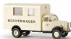
43023 Borgward B4500 „DRK Küchenwagen“