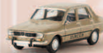
v 14515 Dacia 1300, graubeige, TD