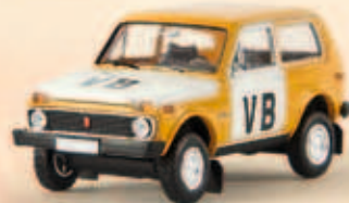
27206 Lada Niva „VB“ aus der ehem. CSSR, TD