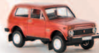
27200 Lada Niva, signalrot, TD