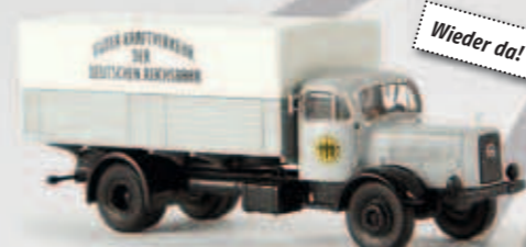
44123 MB L 4500 „Deutsche Reichsbahn“