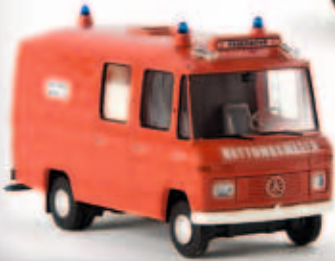
n 36901 MB L 508 RTW „Feuerwehr“, TD