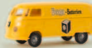
v 32034 VW Kasten T1a „Berga Batterien“