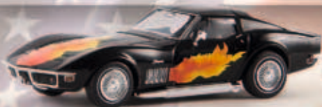
19967 Corvette „Flames“, TD