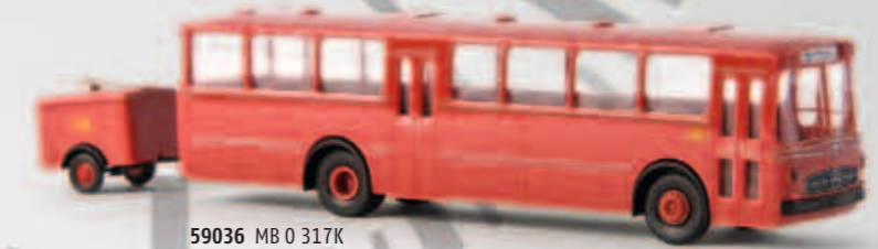
59036 MB O 317K der DB mit Anhänger