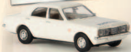
19112 Ford Taunus „Rijkspolitie“ aus den Niederlanden, TD