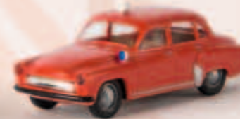
27030 Wartburg 311 Feuerwehr