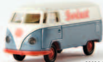
v 32036 VW Kasten T1a „Svelast“