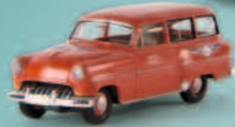
20235 Opel Olympia Caravan „Esso Flugservice“, TD