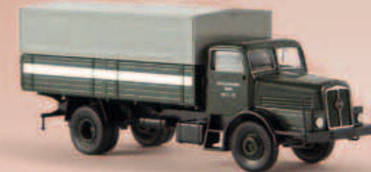
v 71030 IFA H 6 „VEB KVK Zittau RP 28-25“