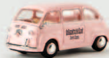
v 22464 Fiat Multipla „La Gazzetta dello Sport“, TD