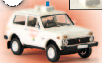
n 27204 Lada Niva „FW Hörnum/Sylt“ (mit neuem Blaulicht!), TD