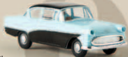
v 20047 Opel P1, hellblau/schwarz