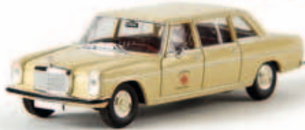
v 13407 MB 220 lang „DRK-Blutspendezentrale“ von Starmada