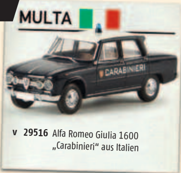
v 29516 Alfa Romeo Giulia 1600 „Carabinieri“ aus Italien