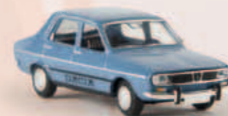
v 14514 Dacia 1300, taubenblau, TD