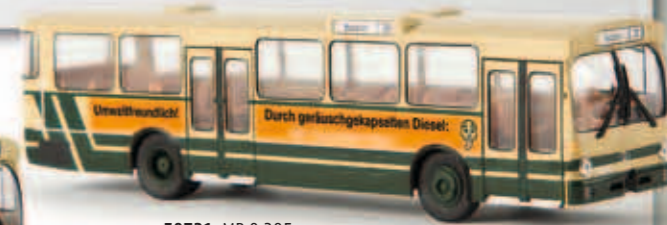
v 50731 MB O 305 „Flüsterbus“, TD