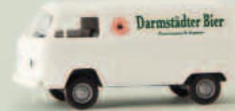
v 33527 VW Kasten T2 „Darmstädter Bier“