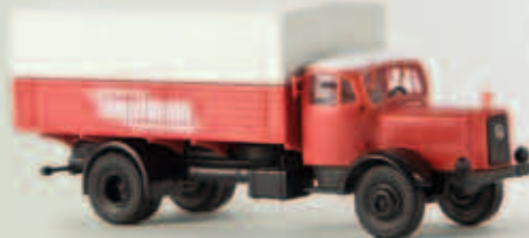
v 44125 MB L 4500 „Tengelmann“