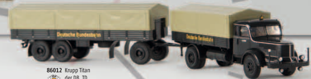
86012 Krupp Titan der DB, TD