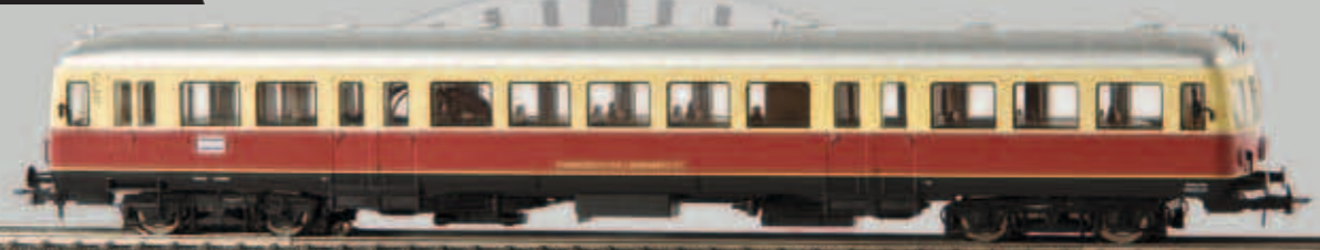
Esslinger Triebwagen VT3, TD v 64106 Hohenzollerische LB, DC v 64125 Hohenzollerische LB, AC