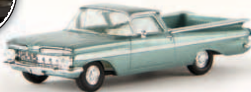
v 19938 El Camino, türkis-metallic/weiß, TD