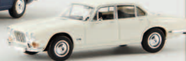
v 13655 Jaguar XI 6, weiß von Starmada