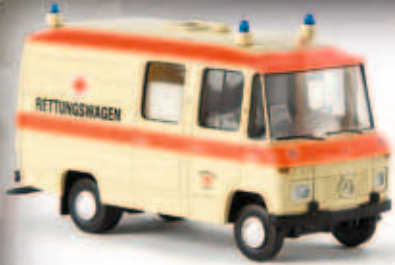
n 36900 MB L 508 RTW „DRK“, TD