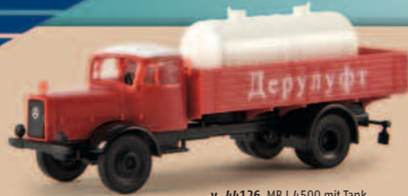
v 44126 MB L 4500 mit Tank „Aeroflot“