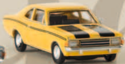
v 20659 Opel Rekord C Coupé „Sport“ von Drummer