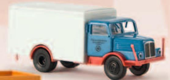
v 71671 IFA S 4000-1 „VEB Sachsenring“