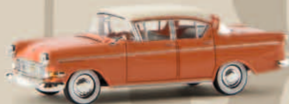
v 20839 Opel Kapitän P 2.5, lachsrot/weiß, TD