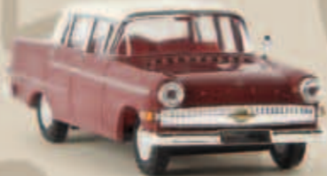
v 20811 Opel Kapitän P 2.6, purpurrot/weiß, TD