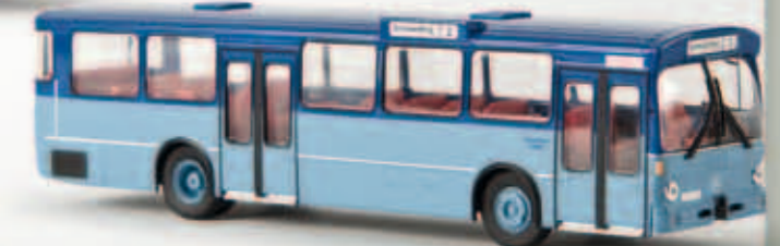
50706 MB O 305 aus Gießen, TD