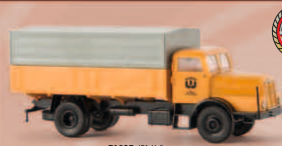
v 71027 IFA H 6 „Glutos“