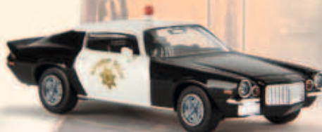
19905 Camaro „Sheriff“ aus den USA, TD