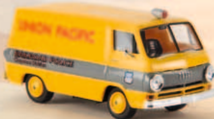
34359 Dodge „Union Pacific“, TD