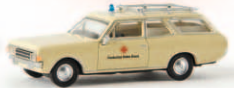
v 20566 Opel Rekord C Caravan „DRK“ von Drummer