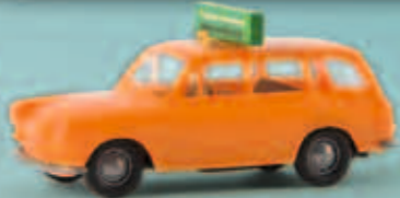
26527 VW Variant „Flughafen Schutzdienst“