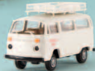
33130 VW Kombi T2 „Interflug“