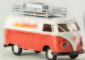
v 32597 VW Kasten T1b „Elektro Dombrowski“ mit Reklameschild