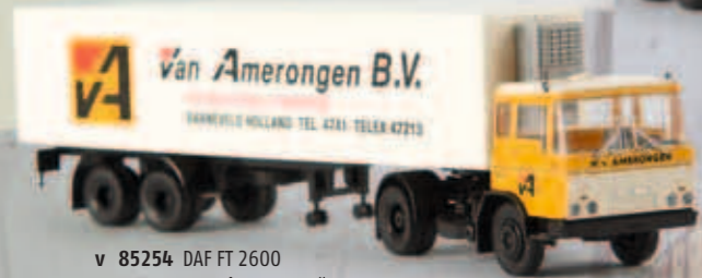
v 85254 DAF FT 2600 „van Amerongen“