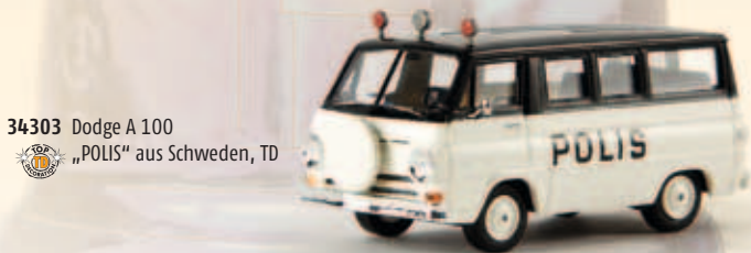
34303 Dodge A 100 „POLIS“ aus Schweden, TD