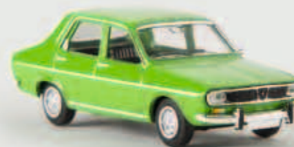
v 14512 Renault 12 TS, grün, TD