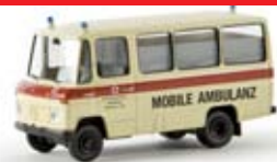
36705 MB O 309 „DRK Mobile Ambulanz“