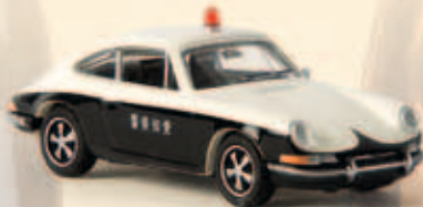
16214 Porsche 911 „Polizei“ aus Japan, TD