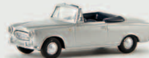
v 29154 Peugeot 403 Cabrio, silber von Drummer