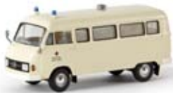
13253 MB L 206 D „DRK“ von Starmada