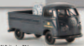
32947 VW Pritsche T1b der DB mit Bahnhofsuhr als Ladegut