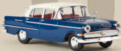
v 20810 Opel Kapitän P 2.6, saphirblau/weiß, TD