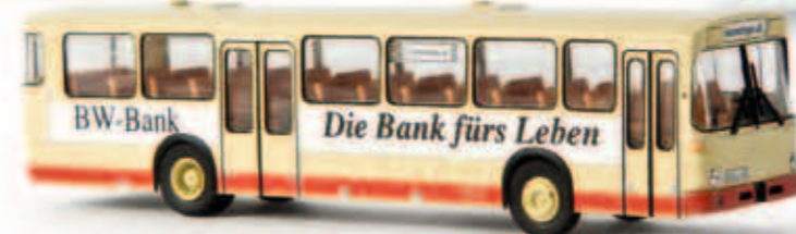
50609 MB O 307 der Hohenzollerischen LB, TD