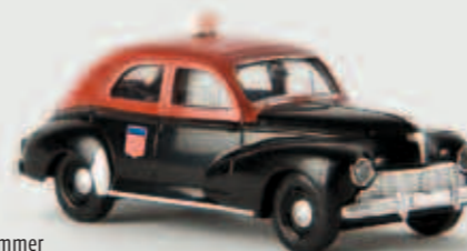
v 29054 Peugeot 203 „Taxi G7“ von Drummer