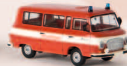
30030 Barkas B 1000 Feuerwehr, TD