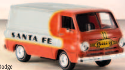
34355 Dodge „Santa Fe“, TD