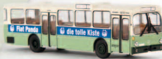
50716 MB O 305 aus Fulda „Fiat Panda“, TD