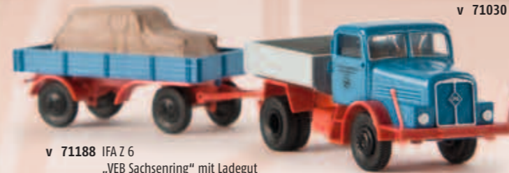
v 71188 IFA Z 6 „VEB Sachsenring“ mit Ladegut