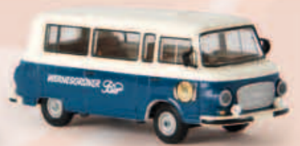
30032 Barkas B 1000 „Wernesgrüner“, TD