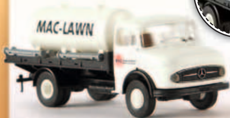
v 47018 MB L 322 mit Tank „Mac Lawn“