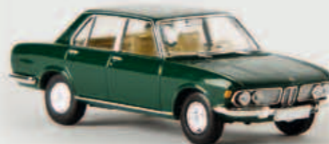
v 13603 BMW 2500, moosgrün von Starmada