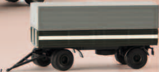
v 55259 Anhänger „RP 35-15“ passend zu „KVK Zittau“