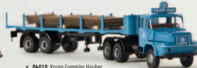
v 84018 Krupp Cummins Hauber „Krupp Stahl“ mit Stahlmatten