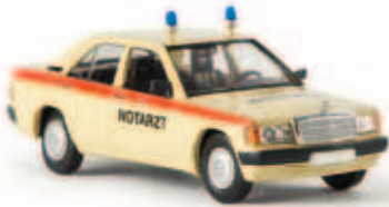
v 13208 MB 190 E „Notarzt“ von Starmada