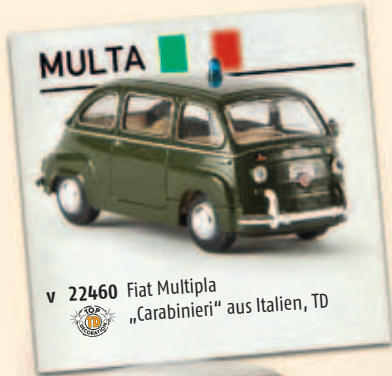
v 22460 Fiat Multipla „Carabinieri“ aus Italien, TD