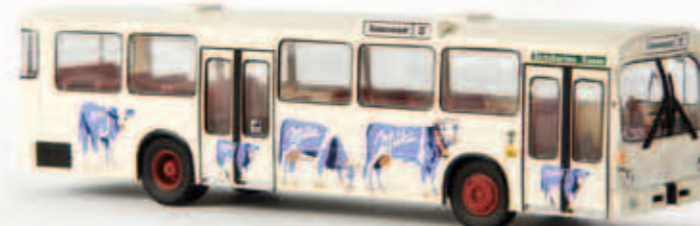
50712 MB O 305 der BVG aus Berlin „Milka“, TD