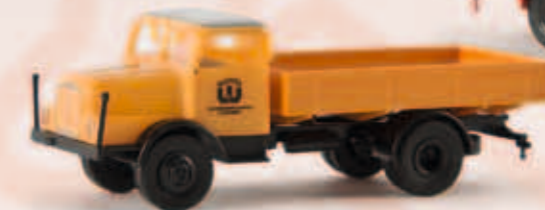
v 71524 IFA S 4000-1 „Glutos“