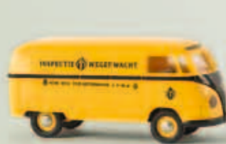
v 32037 VW Kasten T1a „ANWB“