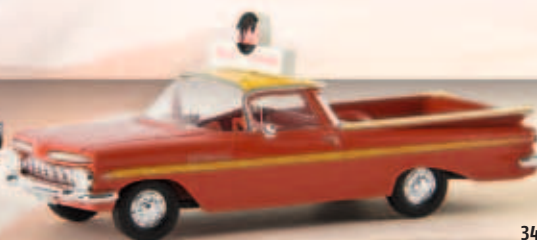
19936 El Camino „Florida East Coast Railway“, TD