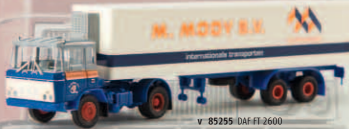
v 85255 DAF FT 2600 „Mooy“