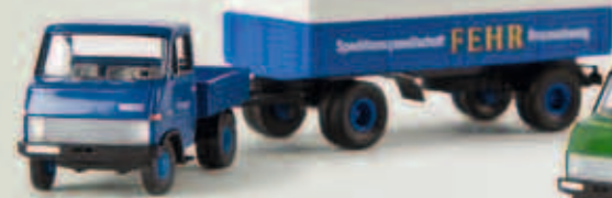
v 37609 HHF/Enser mit Anhänger „Fehr“