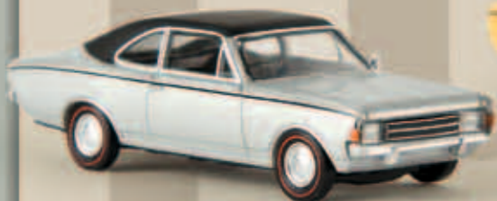
v 20660 Opel Rekord C Coupé, silber/schwarz von Drummer