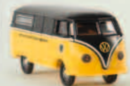
v 32035 VW Kasten T1a „Liebherr“