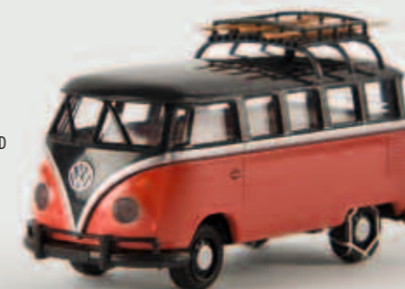
v 31829 VW Mindersamba T1b mit Schneeketten und Ski, TD