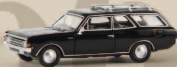
v 20565 Opel Rekord C CarAVan, schwarz von Drummer