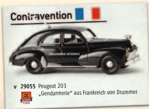
v 29055 Peugeot 203 „Gendarmerie“ aus Frankreich von Drummer