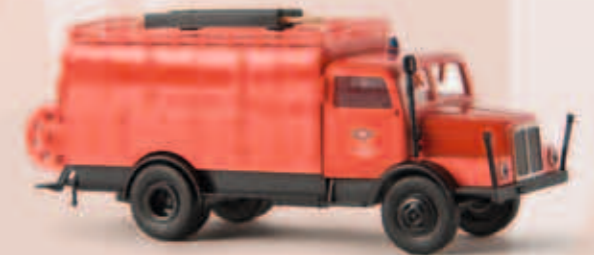
v 71708 IFA S 4000-1 SKW 14 „VEB Chemiehandel Halle“