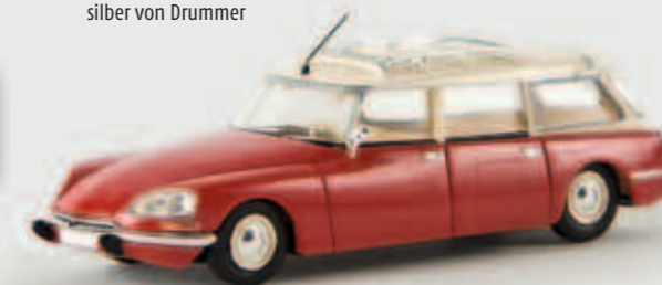
v 14211 Citroen DS Break, karminrot/weiß, TD