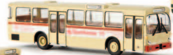
v 50729 MB O 305 aus Karlsruhe „Sparkasse“, TD