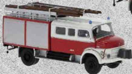
◀ Mercedes LAF 1113 LF 16, Feuerwehr Hessen, mit Vorbaupumpe, 1972 Nr. v 47139 35.95