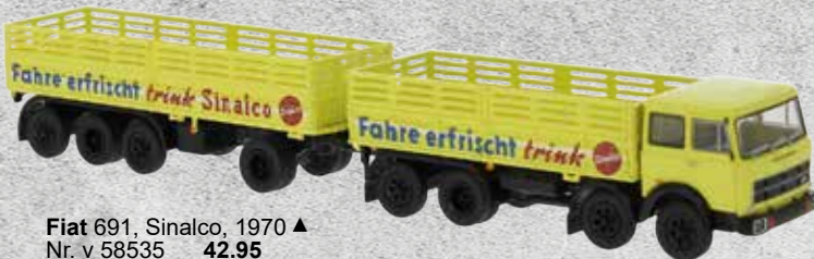
Fiat 691, Sinalco, 1970 ▲ Nr. v 58535 42.95