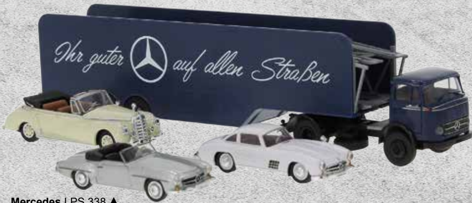
Mercedes LPS 338 ▲ Autotransport-SZ, Mercedes-Benz, mit 3 Riecko-Modelle, 1960 Nr. v 48044 49.95