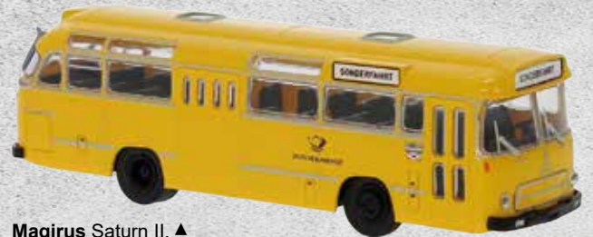
Magirus Saturn II, ▲ Deutsche Bundespost, 1960 Nr. v 59528 34.95