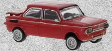
NSU TTS, 1966 ▲ Nr. 28250 15.95