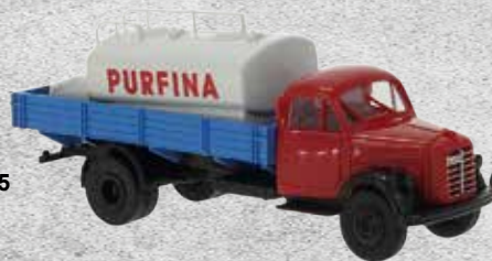
◀ Borgward B 4500 Pritsche, Purfina, 1952 Nr. v 43030 17.95