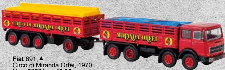
Fiat 691, ▲ Circo di Miranda Orfei, 1970 Nr. v 58534 49.95