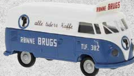
VW T1b Kasten, ▲ Ronne Brugs - Cirkel Kaffe, 1960 Nr. v 32742 17.95