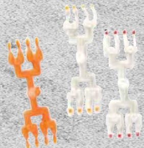
Set mit 24 gelben, ▲ orange und roten Signalleuchten Nr. v 10076 3.95