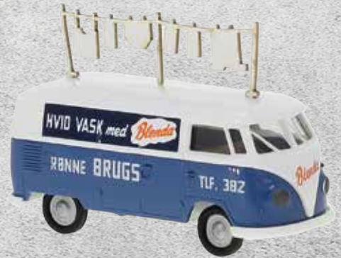
VW T1b Kasten, ▲ Ronne Brugs - Blenda, 1960 Nr. v 32743 19.95