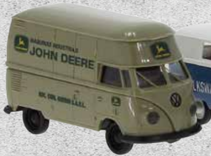
Set mit 3 VW ▲ Bulli aus Südamerika, 1960 Nr. v 90494 49.95