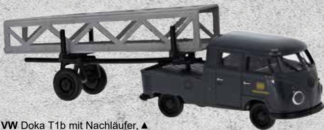
VW Doka T1b mit Nachläufer, ▲ Deutsche Bundesbahn, 1960 Nr. 32832 29.95