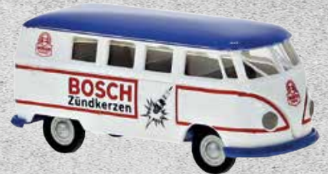
VW T1b Kombi, Bosch Zündkerzen, 1960 Nr. 31606 14.95 ▶