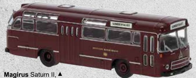
Magirus Saturn II, ▲ Deutsche Bundesbahn, 1960 Nr. 59526 34.95