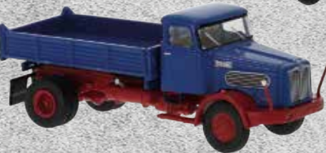
◀ Büssing Commodore SAK Kipper, 1963 Nr. v 79250 27.95