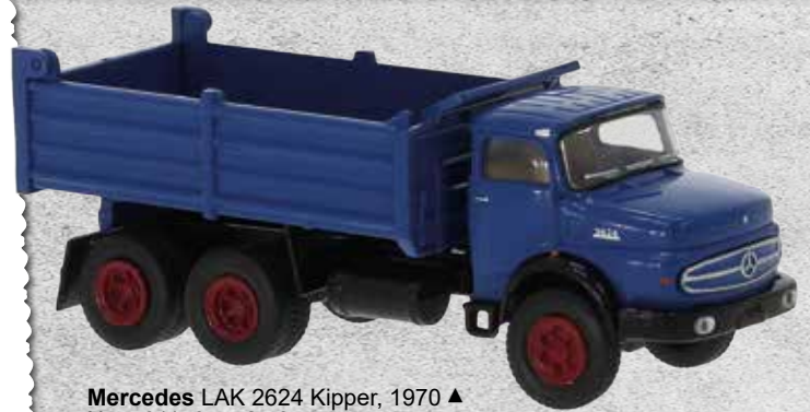
Mercedes LAK 2624 Kipper, 1970 ▲ Nr. n 81150 27.95