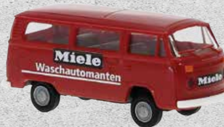
◀ VW T2 Kombi, Miele, 1973 Nr. 33151 13.95