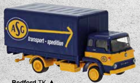
Bedford TK, ▲ ASG, 1971 Nr. 35903 24.95