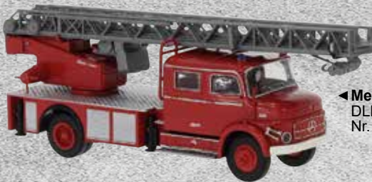
◀ Mercedes L 1519 DLK 30, 1972 Nr. v 47082 37.95