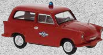
Trabant P 50 Kombi, Feuerwehr, 1960 Nr. v 27562 14.95 ▶