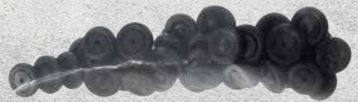
Set mit 40 Oldtimer-Rädern ▲ Nr. v 10072 4.95