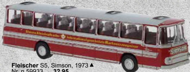
Fleischer S5, Simson, 1973 ▲ Nr. n 59933 32.95