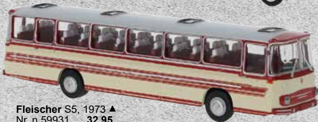
Fleischer S5, 1973 ▲ Nr. n 59931 32.95