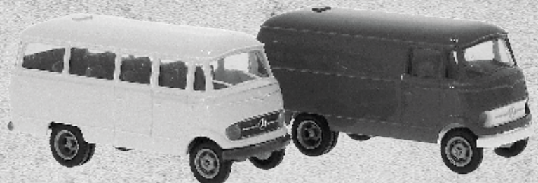
Sortiment zum ▲ Bau zweier MB L/O 319, 1960 Nr. 10212 17.95

Kupplungs-Satz für VT 95 Nr. 10152 11.95