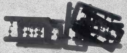
Set mit 28 Rückspiegeln ▲ für Lieferwagen/Transporter Nr. v 10070 3.95