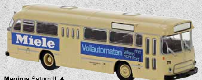
Magirus Saturn II, ▲ "Miele" aus Bielefeld, 1960 Nr. 59521 32.95