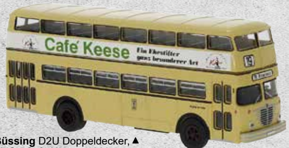
Büssing D2U Doppeldecker, ▲ BVG - Café Keese, 1960 Nr. v 61252 34.95