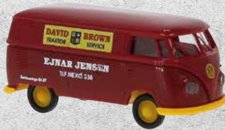
VW T1b Kasten, ▲ David Brown Traktor Service, 1960 Nr. v 32747 12.95