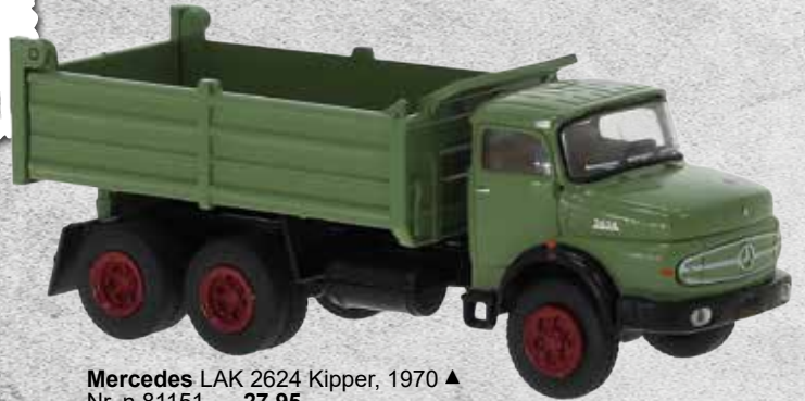
Mercedes LAK 2624 Kipper, 1970 ▲ Nr. n 81151 27.95