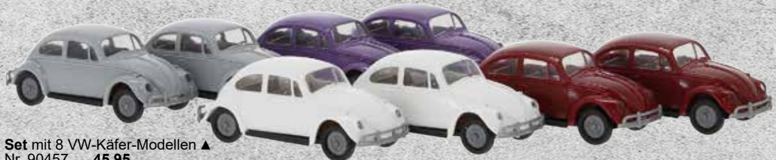
Set mit 8 VW-Käfer-Modellen ▲ Nr. 90457 45.95