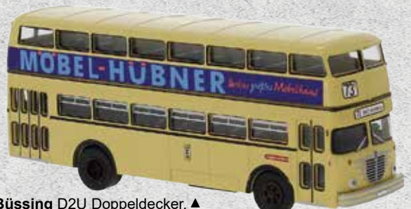
Büssing D2U Doppeldecker, ▲ BVG - Möbel Hübner, 1960 Nr. v 61253 34.95