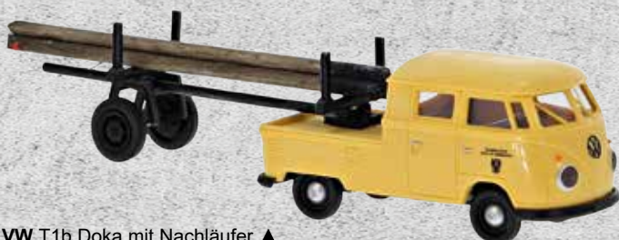
VW T1b Doka mit Nachläufer, ▲ Österreichische Post, 1960 Nr. 32836 29.95