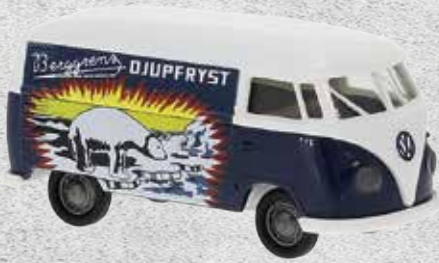
VW T1b Kasten, ▲ Bergrens Djupfryst, 1960 Nr. v 32738 14.95