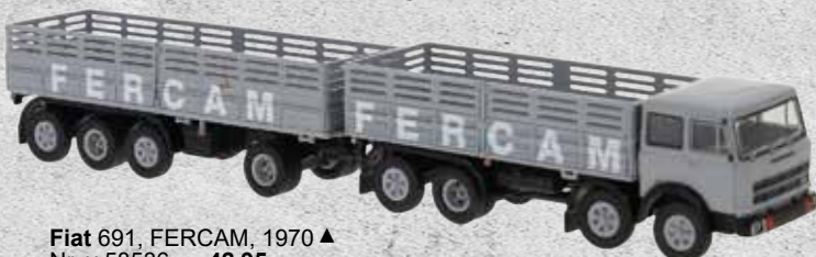
Fiat 691, FERCAM, 1970 ▲ Nr. v 58536 42.95