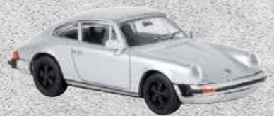
Porsche 911 G, TD, 1976 ▲ Nr. 16320 14.95