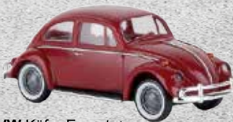
VW Käfer Export ▲ Nr. 25044 12.95