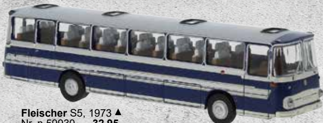
Fleischer S5, 1973 ▲ Nr. n 59930 32.95