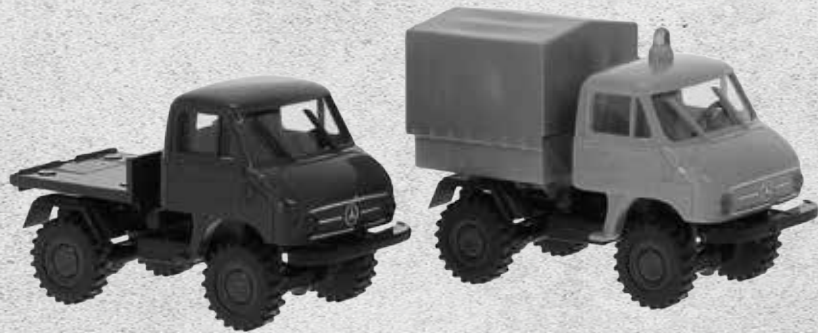
Sortiment zum ▲ Bau zweier MB Unimog 411, 1955 Nr. v 10217 17.95