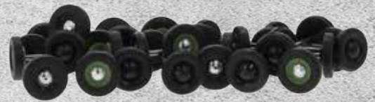
Set mit 16 Radsätzen ▲ (Räder und Achsen für 4 Fahrzeuge) Nr. v 10073 5.95