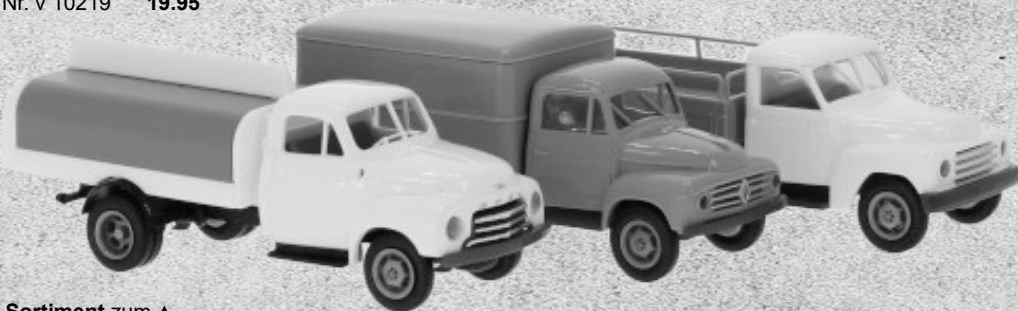
Sortiment zum ▲ Bau dreier Leichtlastwagen, 1955 Nr. 10213 24.95