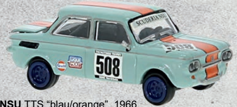
NSU TTS "blau/orange", 1966 Nr. 28259 17.95 € ▲