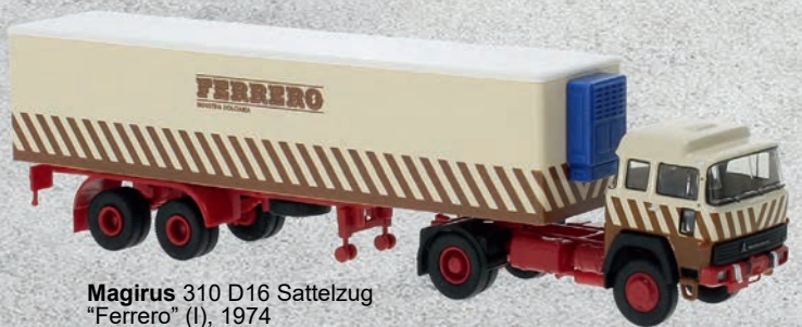
Magirus 310 D16 Sattelzug "Ferrero" (I), 1974 Nr. v 83284 29.95 € ▲