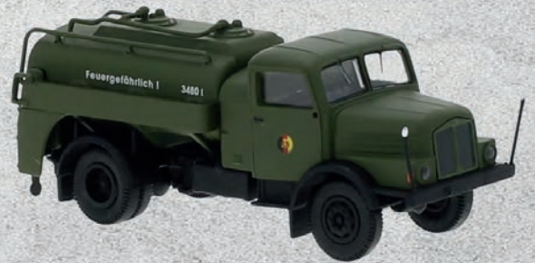
IFA S 4000-1 Tankwagen der NVA, 1960 Nr. 71477 29.95 € ▲