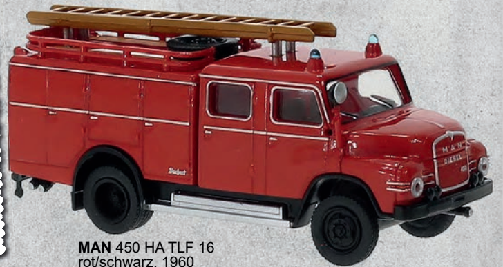
MAN 450 HA TLF 16 rot/schwarz, 1960 Nr. n 45130 31.95 € ▲