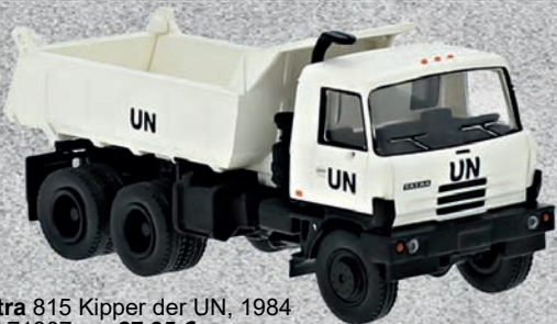
Tatra 815 Kipper der UN, 1984 Nr. 71907 27.95 € ▲