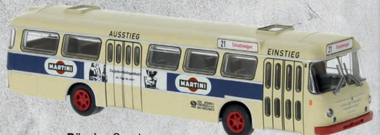
Büssing Senator "Martini" aus Bad Kreuznach, 1962 Nr. 59367 34.95 € ▲