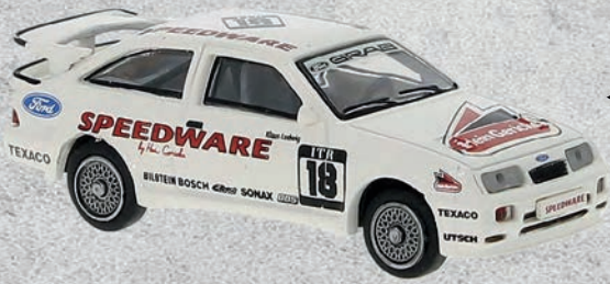
◀ Ford Sierra RS Cosworth, Klaus Ludwig DTM '88, 1988 Nr. 19255 19.95 €