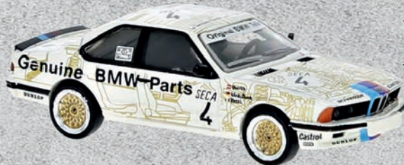
◀ BMW 635 CSI "BMW parts", 1983 Nr. 24364 19.95 €