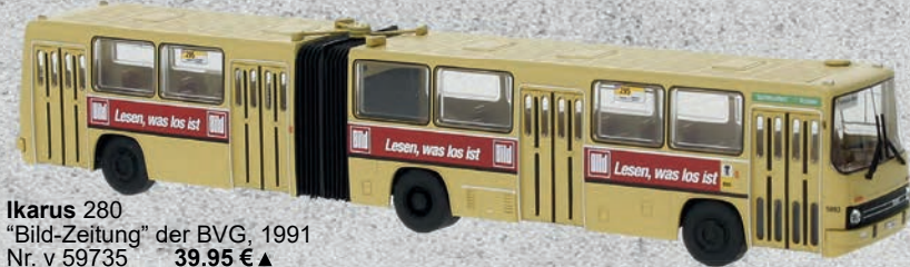
Ikarus 280 "Bild-Zeitung" der BVG, 1991 Nr. v 59735 39.95 € ▲