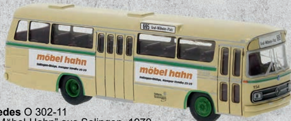
Mercedes O 302-11 "154-Möbel-Hahn" aus Solingen, 1970 Nr. v 52157 33.95 € ▲