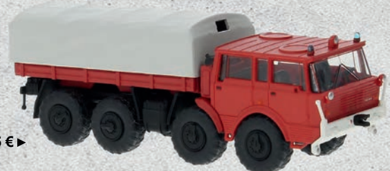
Tatra 813 Kolos "Feuerwehr", 1968 Nr. 71937 27.95 € ►