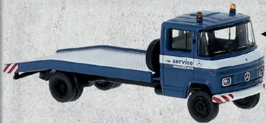
◀ Mercedes L608D Abschlepper des "MB service", 1968 Nr. v 36736 24.95 €