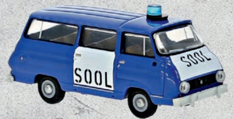
Skoda 1203 Bus "SOOL", 1969 Nr. 30818 17.95 € ►