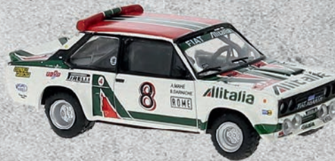
◀ Fiat 131 Abarth Alitalia "Darniche Monte 78", 1978 Nr. n 22653 21.95 €