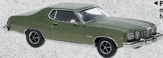
◀ Ford Gran Torino , metallic-grün, 1976 Nr. v 19726 19.95 €