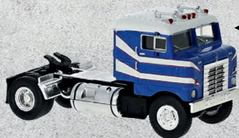
◀ Kenworth Bullnose, 1950 Nr. 85955 24.95 €