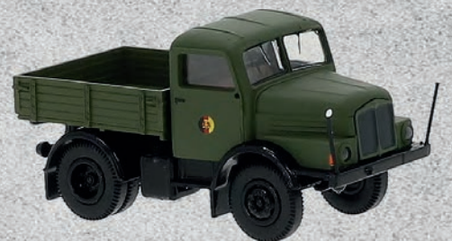
IFA S 4000-1 Zugmaschine der NVA, 1960 Nr. v 71457 19.95 € ▲