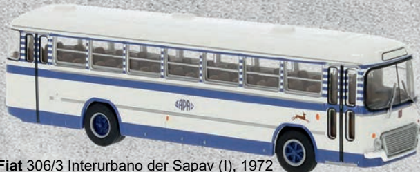
Fiat 306/3 Interurbano der Sapav (I), 1972 Nr. v 59909 34.95 € ▲