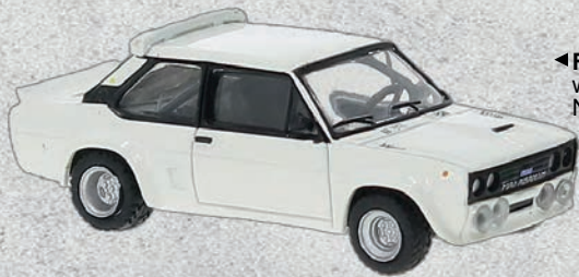
◀ Fiat 131 Abarth, weiß, 1975 Nr. n 22650 19.95 €