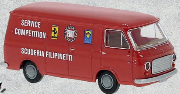
Fiat 238 "Scuderia Filipinetti", 1966 Nr. 34466 18.95 € ▲