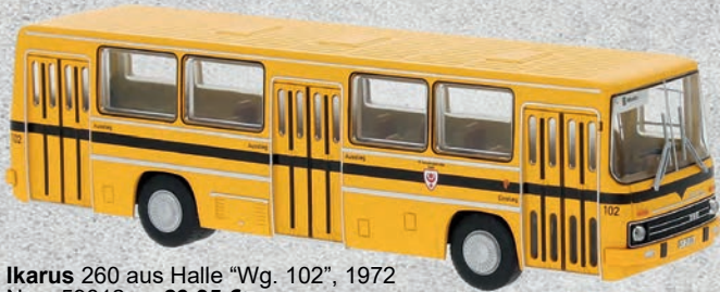
Ikarus 260 aus Halle "Wg. 102", 1972 Nr. v 59812 29.95 € ▲