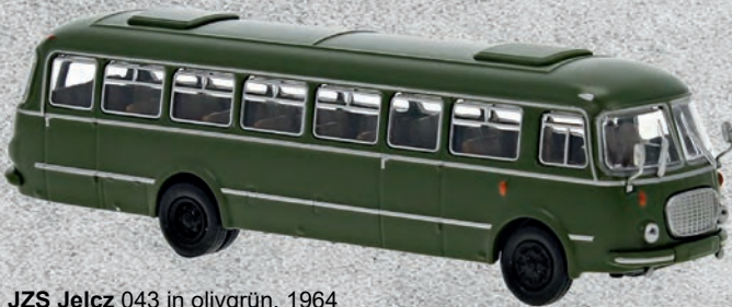
JZS Jelcz 043 in olivgrün, 1964 Nr. 58267 29.95 € ▲