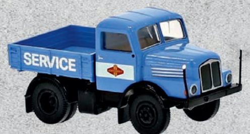
IFA S 4000-1 Zugmaschine "Fortschritt", 1960 Nr. 71455 19.95 € ▲