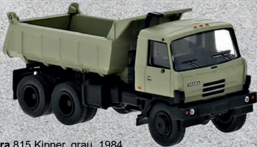
Tatra 815 Kipper, grau, 1984 Nr. 71902 26.95 € ▲