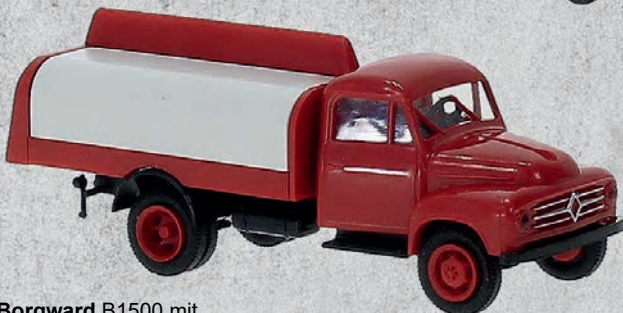
Borgward B1500 mit Getränkeaufbau, Economy, 1954 Nr. v 38034 12.95 € ▲