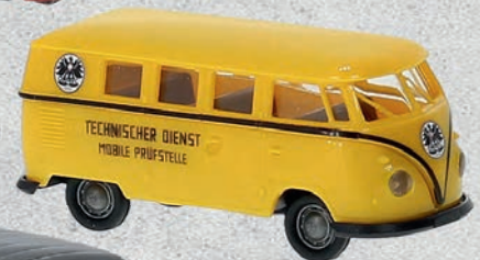
VW T1 b Kombi "ÖAMTC" (A), 1960 Nr. v 31623 16.95 € ▶