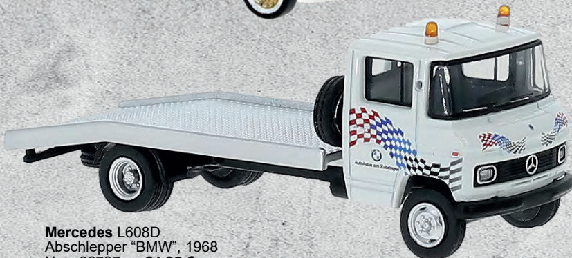
Mercedes L608D Abschlepper "BMW", 1968 Nr. v 36737 24.95 € ▲