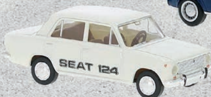
◀ Seat 124, weiß €, 1968 Nr. v 22419 14.95 €