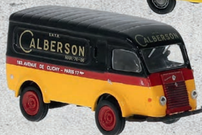
◀ Renault 1000kg "Calberson" (F), 1950 Nr. 14667 16.95 €