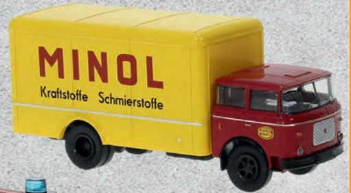
LIAZ 706 Koffer "Minol", 1970 Nr. v 71860 21.95 € ►