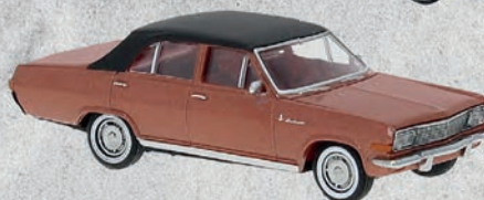
◀ Opel Diplomat A, kupfer, 1964 Nr. 20762 14.95 €