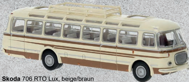
Skoda 706 RTO Lux, beige/braun Nr. v 58238 29.95 € ▲