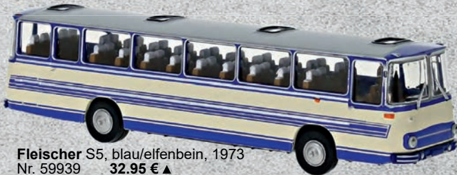
Fleischer S5, blau/elfenbein, 1973 Nr. 59939 32.95 € ▲