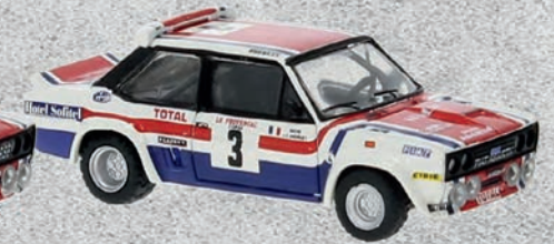
Set "Korsika 78" mit Servicewagen und 2 x 131 Abarth "Andruet" und "Mouton", 1974 Nr. n 22664 49.95 € ▲