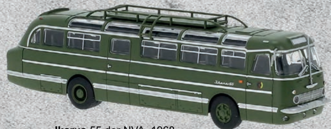
Ikarus 55 der NVA, 1968 Nr. 59470 32.95 € ▲