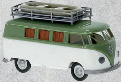
◀ VW T1b Camper, 1960 Nr. v 31624 14.95 €