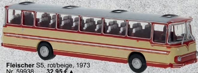
Fleischer S5, rot/beige, 1973 Nr. 59938 32.95 € ▲