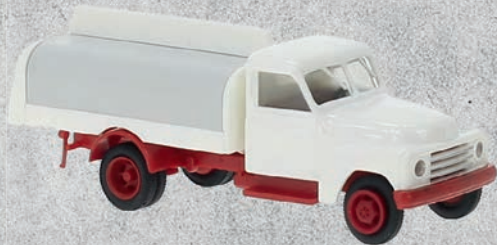
◀ Hanomag L 28 mit Getränkeaufbau, Economy, 1950 Nr. v 37147 12.95 €