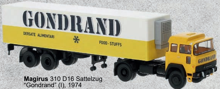
Magirus 310 D16 Sattelzug "Gondrand" (I), 1974 Nr. v 83285 29.95 € ▲