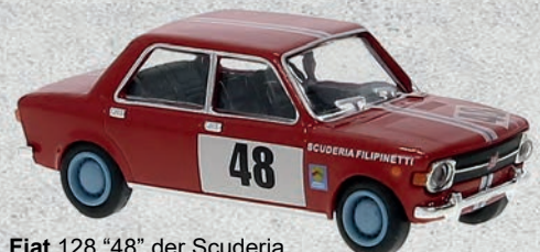
Fiat 128 "48" der Scuderia Filipinetti, 1969 Nr. 22542 18.95 € ▲