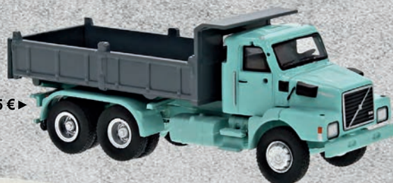
Volvo N10 Kipper (S), 1980 Nr. 85655 27.95 € ▶