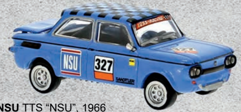
NSU TTS "NSU", 1966 Nr. 28257 17.95 € ▲