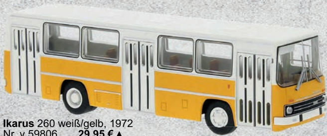
Ikarus 260 weiß/gelb, 1972 Nr. v 59806 29.95 € ▲