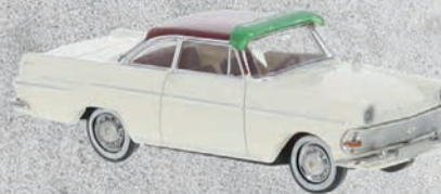
◀ Opel P2 Coupé, 1960 Nr. 20133 15.95 €