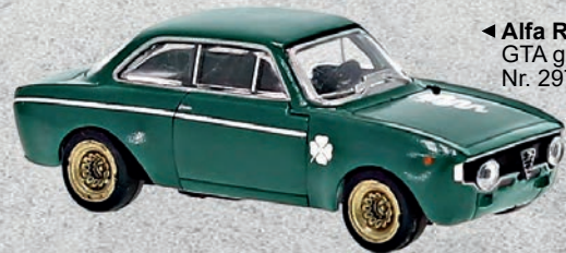
◀ Alfa Romeo GTA grün, 1971 Nr. 29704 16.95 €