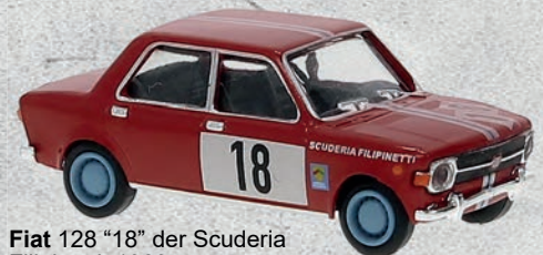
Fiat 128 "18" der Scuderia Filipinetti, 1969 Nr. 22541 18.95 € ▲