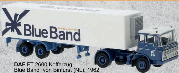
DAF FT 2600 Kofferzug "Blue Band" von Binfürst (NL), 1962 Nr. v 85291 29.95 € ▲