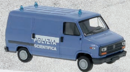
Fiat Ducato "Polizia" (I), 1982 Nr. 34917 18.95 € ▶