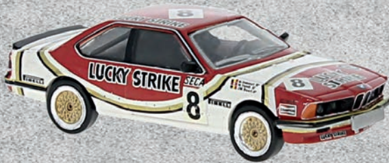
◀ BMW 635 CSI "Lucky Strike", 1983 Nr. 24362 19.95 €