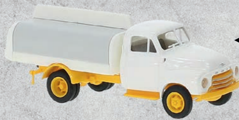
◀ Opel Blitz mit Getränkeaufbau, Economy, 1952 Nr. v 35340 12.95 €