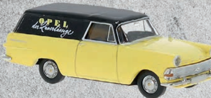
◀ Opel P2 Kasten "Opel der Zuverlässige", 1960 Nr. 20194 15.95 €