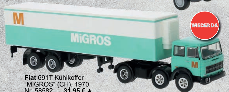
Fiat 691T Kühlkoffer "MIGROS" (CH), 1970 Nr. 58582 31.95 € ▲