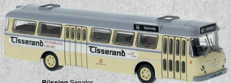
Büssing Senator "Tisserand" aus Frankfurt, 1962 Nr. 59371 34.95 € ▲