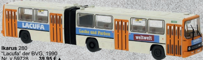
Ikarus 280 "Lacufa" der BVG, 1990 Nr. v 59728 39.95 € ▲