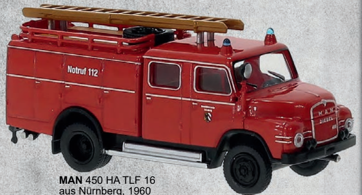
MAN 450 HA TLF 16 aus Nürnberg, 1960 Nr. n 45134 32.95 € ▲