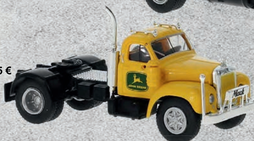
◀ Mack B61 "John Deere", gelb, 1953 Nr. 85978 24.95 €