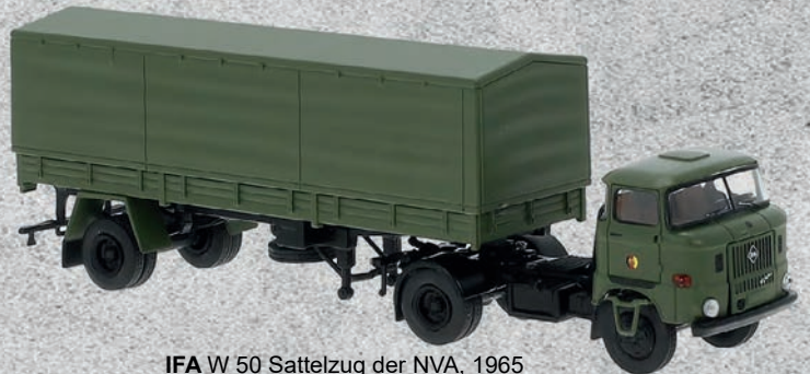
IFA W 50 Sattelzug der NVA, 1965 Nr. 71205 29.95 € ▲