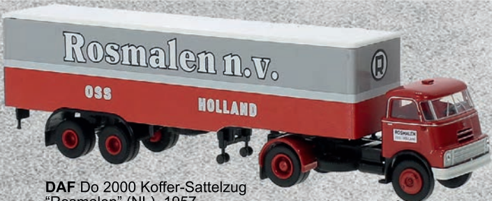
DAF Do 2000 Koffer-Sattelzug "Rosmalen" (NL), 1957 Nr. v 85232 29.95 € ▲