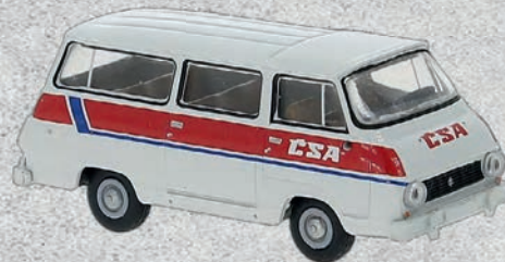
◀ Skoda 1203 Bus "Csa", 1969 Nr. 30820 17.95 €