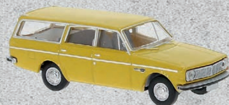
Volvo 145 , gelb (S), 1966 Nr. 29469 13.95 € ▶