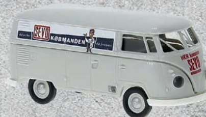
◀ VW T1b Kasten "SEVO-Kobmanden" (DK), 1960 Nr. v 32766 14.95 €