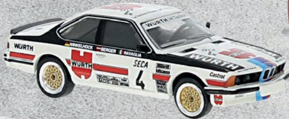
BMW 635 CSI "Würth", 1984 Nr. 24363 19.95 € ▶