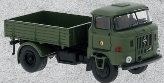
IFA W50 Zugmaschine der NVA, 1965 Nr. 71252 22.95 € ▲