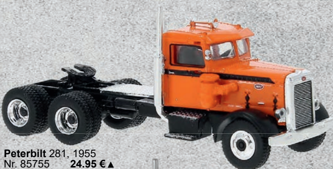
Peterbilt 281 , 1955 Nr. 85755 24.95 € ▲