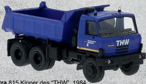
Tatra 815 Kipper des "THW", 1984 Nr. v 71906 27.95 € ▲