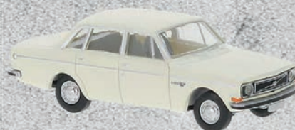
◀ Volvo 144 , weiß (S) Nr. 29412 13.95 €