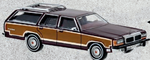
◀ Ford LTD Country Squire, 1979 Nr. 19627 19.95 €