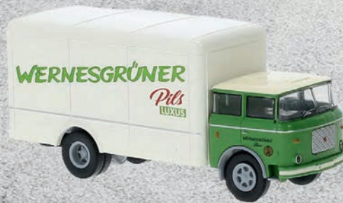
◀ LIAZ 706 Koffer "Wernesgrüner", 1970 Nr. v 71859 21.95 €