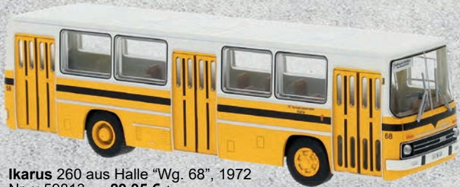
Ikarus 260 aus Halle "Wg. 68", 1972 Nr. v 59813 29.95 € ▲