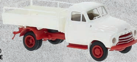
◀ Opel Blitz mit Getränkepritsche, Economy, 1952 Nr. v 35342 10.95 €