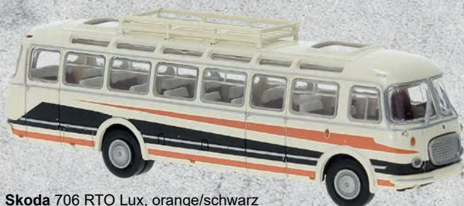
Skoda 706 RTO Lux, orange/schwarz Nr. v 58240 29.95 € ▲