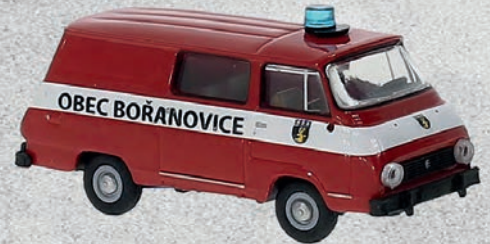
Skoda 1203 FW "Obec Boranovice", 1969 Nr. v 30821 19.95 € ►