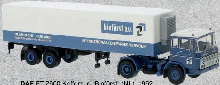
DAF FT 2600 Kofferzug "Binfürst" (NL), 1962 Nr. v 85292 29.95 € ▲