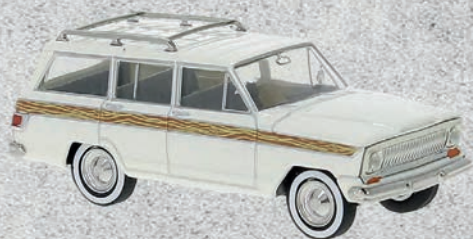
◀ Jeep Wagoneer B "Woody", 1968 Nr. 19870 18.95 €