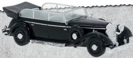
◀ Mercedes 770K, schwarz, 1938 Nr. n 21050 19.95 €