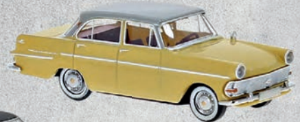
Opel P2 Limousine, 1960 Nr. 20149 14.95 € ▶