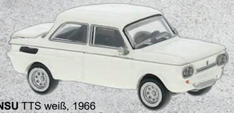
NSU TTS weiß, 1966 Nr. v 28260 15.95 € ▲