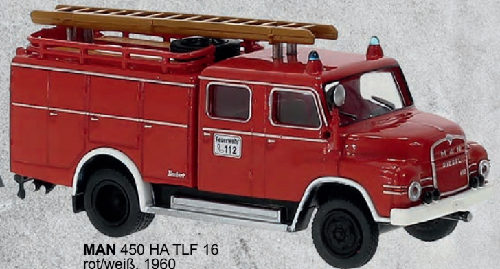
MAN 450 HA TLF 16 rot/weiß, 1960 Nr. n 45131 31.95 € ▲