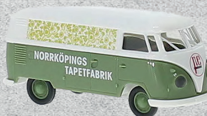
◀ VW T1b Kasten "Norrköpings Tapetfabrik" (S), 1960 Nr. v 32783 13.95 €