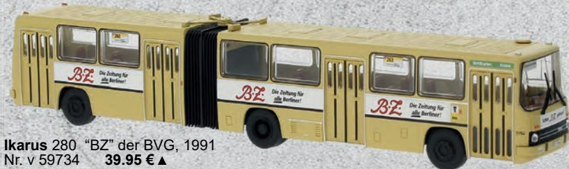
Ikarus 280 "BZ" der BVG, 1991 Nr. v 59734 39.95 € ▲