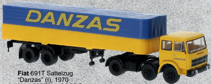
Fiat 691T Sattelzug "Danzas" (I), 1970 Nr. v 58578 31.95 € ▲