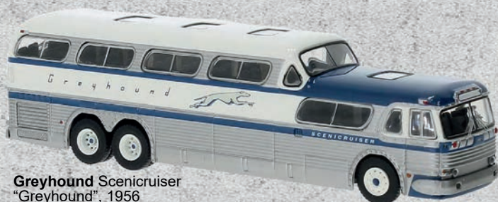
Greyhound Scenicruiser "Greyhound", 1956 Nr. 61300 32.95 € ▲