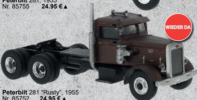
Peterbilt 281 "Rusty" , 1955 Nr. 85752 24.95 € ▲