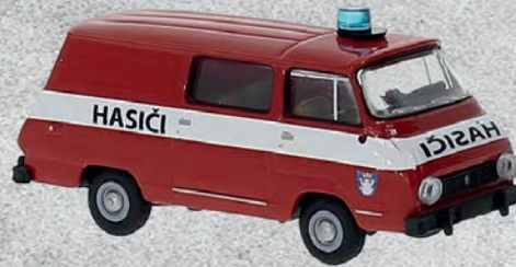
◀ Skoda 1203 FW "Hasiči", 1969 Nr. v 30822 19.95 €