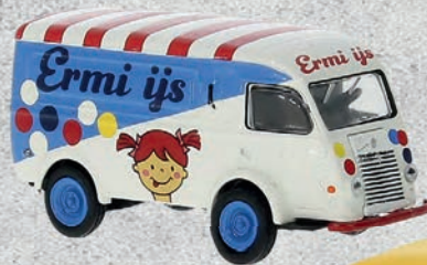
◀ Renault 1000kg "Ermi ijs" (NL), 1950 Nr. 14662 17.95 €