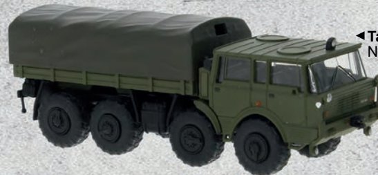
◀ Tatra 813 Kolos, 1968 Nr. 71930 27.95 €