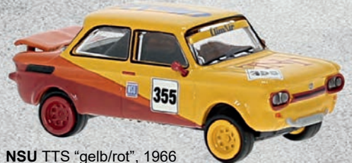
NSU TTS "gelb/rot", 1966 Nr. 28255 18.95 € ▲